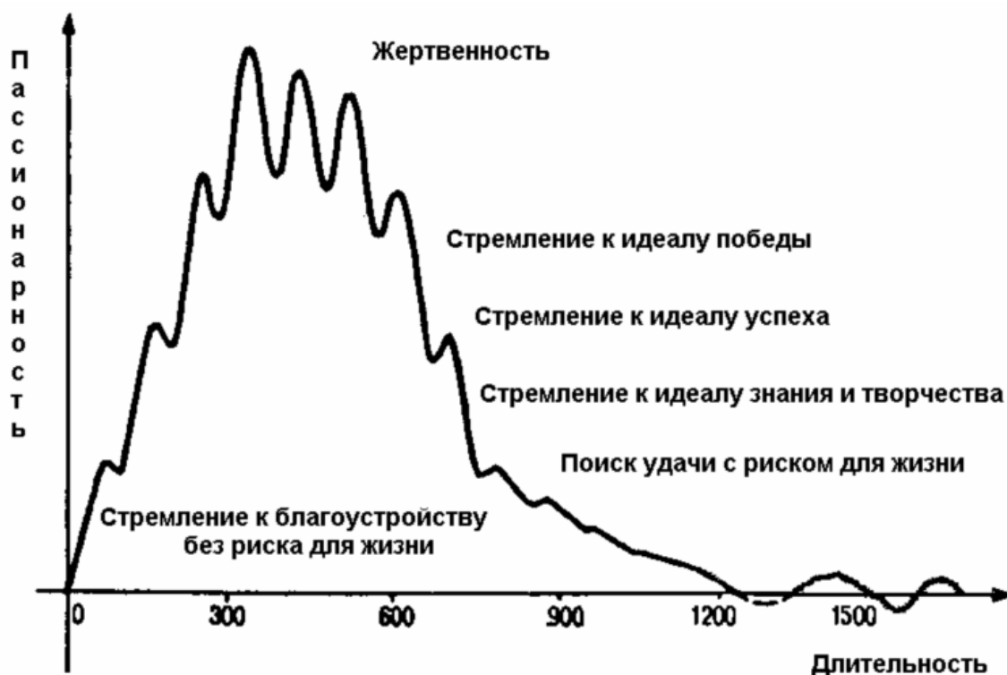
Рис. 2. Кривая пассионарного напряжения

ФАЗЫ Подъём Акматическая Надлом Инерционная Обскурация Регенерация Реликт